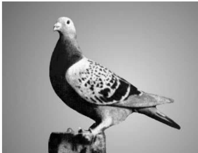
"Zilvervosje" x "86" (NL47-433488 X NL47-433486)