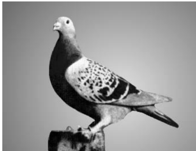
"Zilvervosje" x "86" (NL47-433488 X NL47-433486)